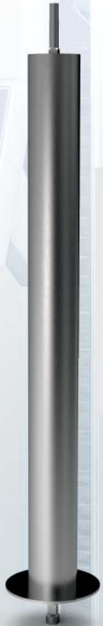
Döner Şişi Doner Skewer

It includes automatic doner machine spare parts, machining spare parts, motors, electronic board, sensors, tray and other equipment, radian, thermocouple and all other materials used. The stock and production or supply of all these materials are delivered to our customers in the fastest way by our company in accordance with quality standards.