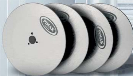
Döner Kesme Bıçağı Doner Cutting Blade