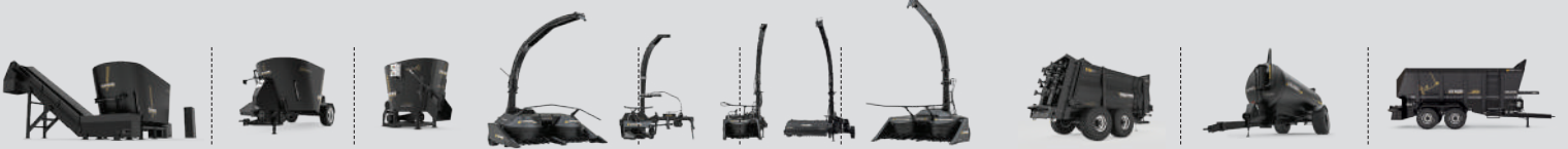
DİKEY HELEZONLU YEM KARMA MAKİNELERİ