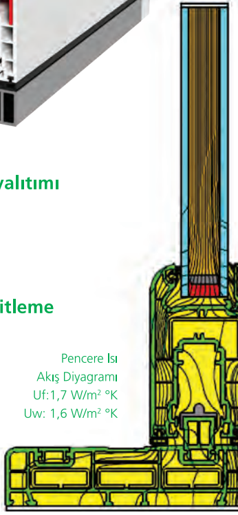
Pencere Isı Akış Diyagramı Uf: 1,7 W/m² °K Uw: 1,6 W/m² °K