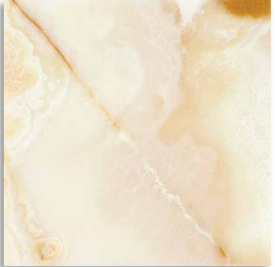
Oniks Açık Onyx Light