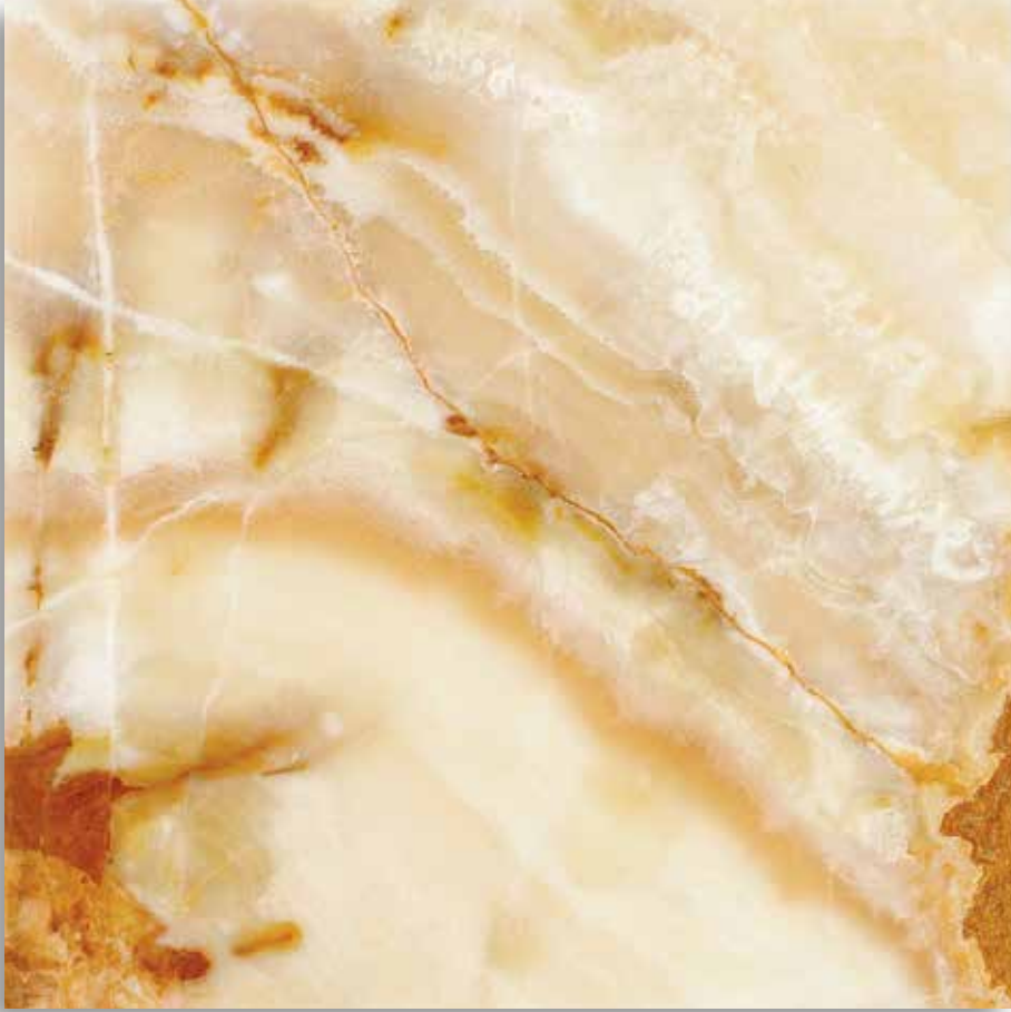
Oniks Bal Altın Onyx Honey Gold