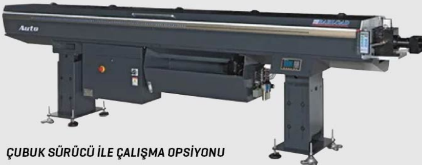
ÇUBUK SÜRÜCÜ İLE ÇALIŞMA OPSİYONU