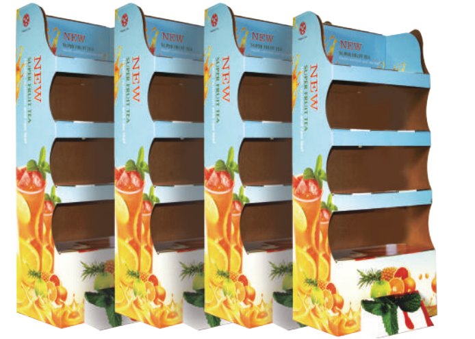
Kullanıma hazır baskılar