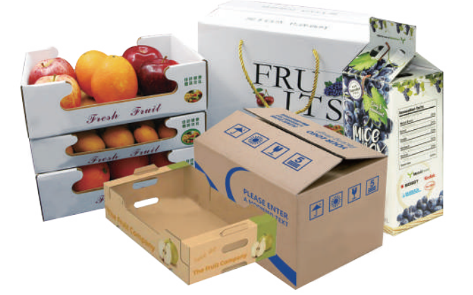
Han FullColor® Gıda'ya zarar vermeyen mürekkep