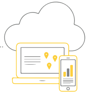
Bilgisayar kontrol paneli ile tam kontrol