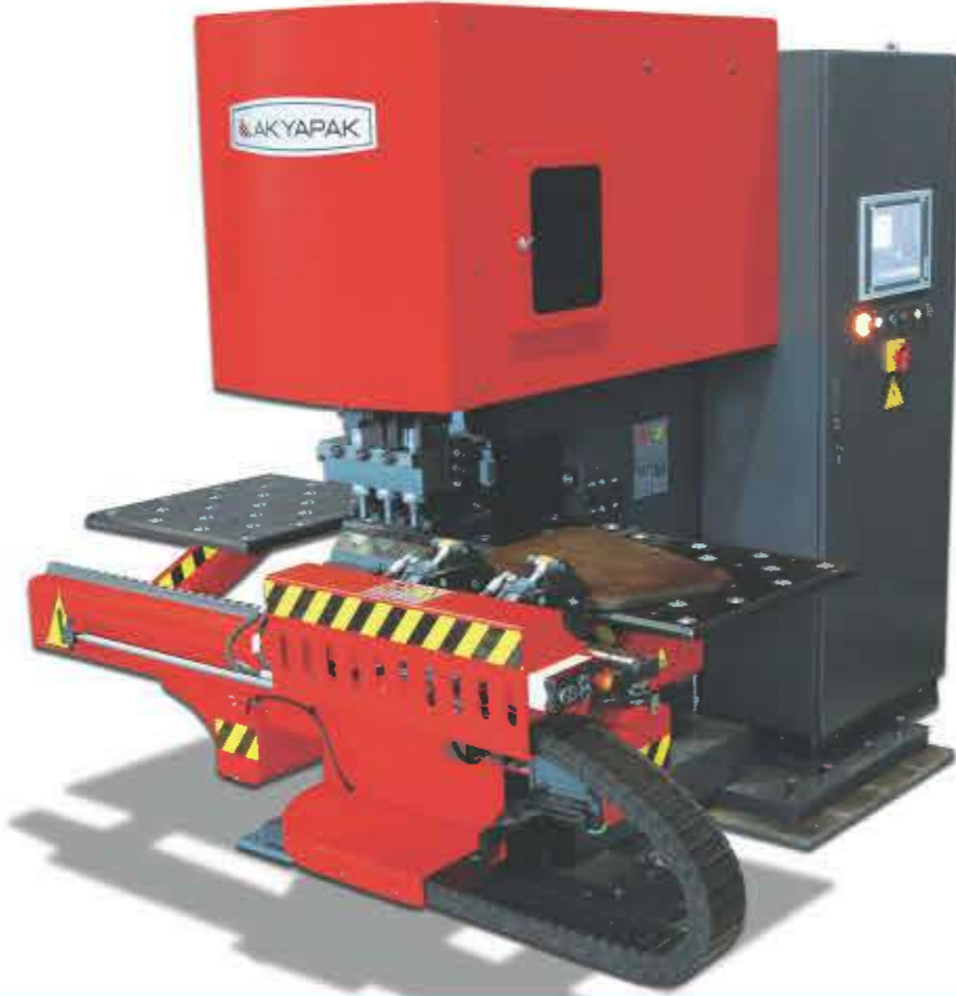
PLATE PUNCHING MACHINE ZIMBA MAKİNESİ

The maximum plate size and weight for positioning with standard programming are 1000x500 mm and 100 kg for the APP 80 model. Only the area, which is suitable for punching, of the plate with 1000x500 mm size and 250 kg weight can be punched manually.