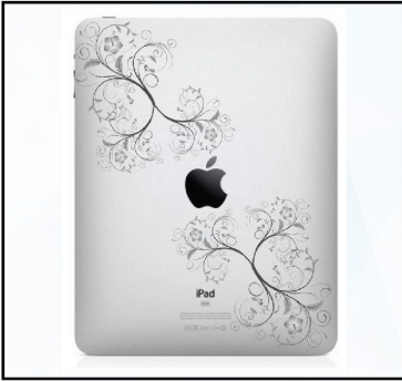
Tablet Desen Markalama