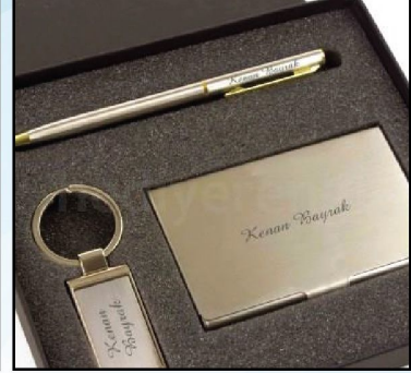
Hediye Seti Markalama