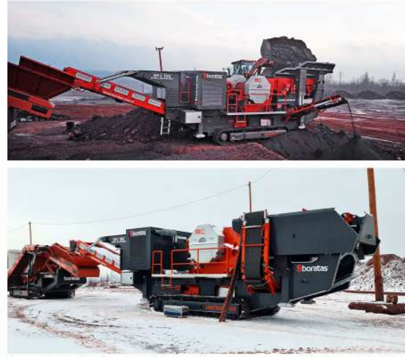
Aşırı soğuk ortamlar da dahil olmak üzere zor durumlar için inşa edilmiştir. Katlanabilirlik özelliği sayesinde taşıma kolaylığı sağlar.

BORATAŞ MOBİL MAKİNELER KOMBİNE EDİLEREK KOLAYCA MOBİL BİR TESİS KURULABİLİR.