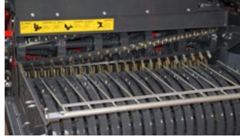
GENİŞ HAŞBAY VE TOPLAMA SİSTEMİ WIDE CHOPPING AND COLLECTION SYSTEM