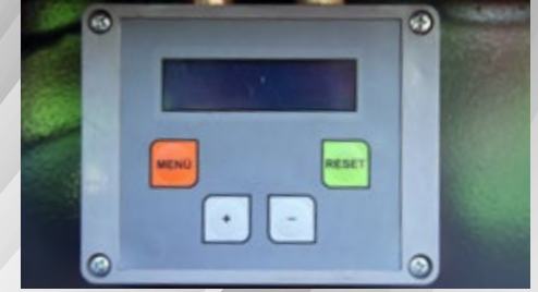
DİJİTAL BALYA SAYACI DIGITAL BALE COUNTER