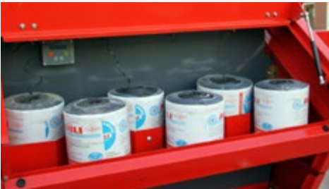
ÇOKLU İP SANDIĞI MULTIPLE ROPE BOX