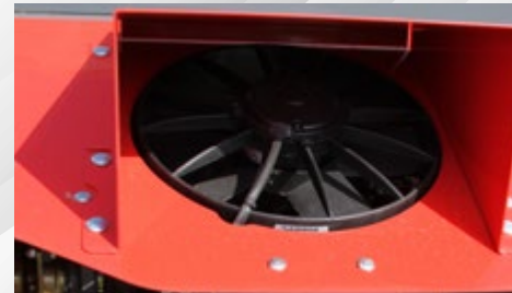
GÜÇLÜ FAN SİSTEMİ BINDING GROUP CLEANING FAN