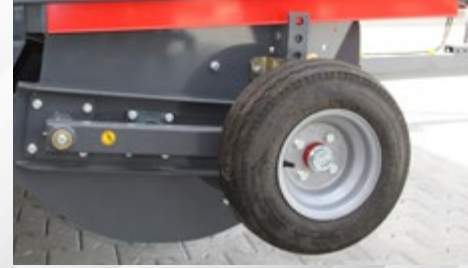
YAN TABLA TEKERİ SIDE TABLE WHEEL