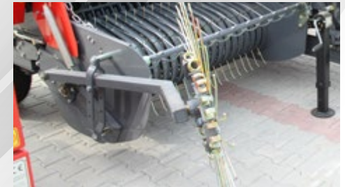
YAN TIRMIK DÜZENİ SIDE RAKE ARRANGEMENT