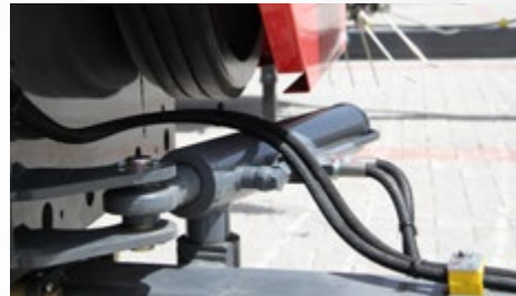
HİDROLİK ÇEKİ OKU HYDRAULIC TONGUE