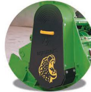
- 6'lı Kayış Güvenlik Sitemi-