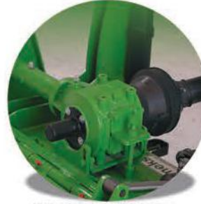
-İtalyan Tasarım Şanzıman-