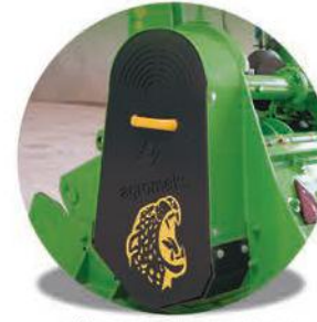
-6'lı Kayış Güvenlik Sistemi-