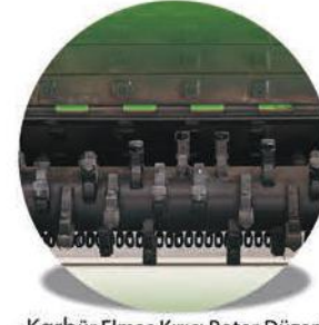
-Karbür Elmas Kırıcı Rotor Düzeni-