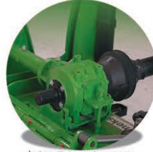
- İtalyan Tasarım Şanzıman-