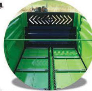
-Çift Sıra Zincirli Konveyör Sistem-