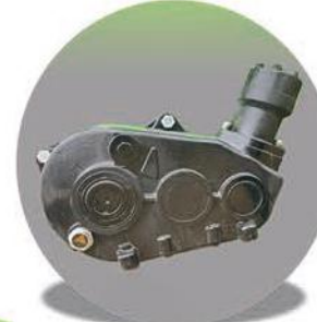
-Güçlü Şanzıman Güçlü Makine-

PANTER-10, daha büyük kapasiteye sahip bir tarım makinesi olarak öne çıkar. 725 cm uzunluğunda ve 210 cm genişliğindedir, ayrıca 240 cm yüksekliğe sahiptir. Bu model, 3900 kg ağırlığında ve çift dingil (tandem) sistemi kullanır. Hidrolik konveyör sistemi ile donatılmıştır ve 10 m 3 kapasiteye sahiptir, bu da 12 ton gübre taşıma kapasitesi anlamına gelir. Kuyruk mili - PTO ile çalışan bir spiral hareketi ve 12 mm ısıl işlemlenmiş zincirleri vardır. Lastik boyutu 400/60-15,5'tir. Minimum gereken güç 75 beygir gücüdür ve 540 devir/dakika kuyruk mili devrine sahiptir. Gübre dağıtma genişliği 5-15 m arasında ayarlanabilir. 2 yıl garantilidir. -Çift Sıra Zincirli Konveyör Sistem, Gübreyi homojen bir şekilde taşır. 12mm ısıl işlem görmüş zincirleri taş vb. cisimlere karşı dayanıklıdır. -Çift Tepsili , Tokatlamalı Dağıtıcılar 15metreye kadar gübre atım imkanı sağlar. -Özel tasarım şanzımanlarımız ani yük değişimlerine karşı özel olarak üretilmiştir