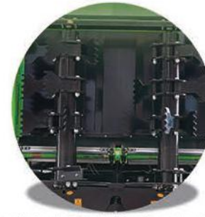
-Çift Tepsili ve Tokatlamalı Dağıtıcı Sistem-