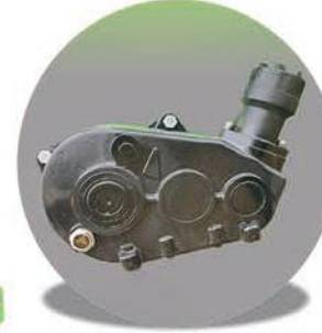
-Güçlü Şanzıman Güçlü Makine-