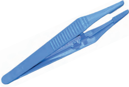
CERRAHİ CIMBIZ / Surgical Tweezer 41066