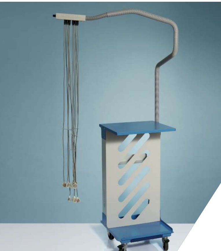
Sistema di elettrodi a suzione VACU.