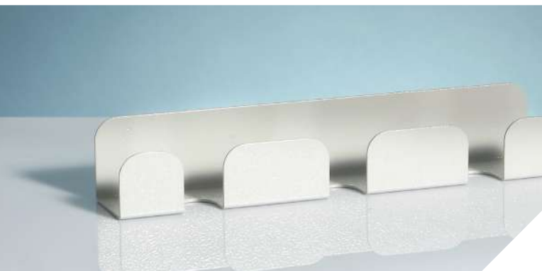
Reggisonda per ecografi ecc.