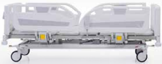
Sırt Hareketi / Backrest