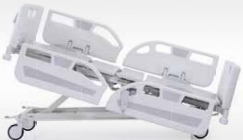
Kardiyak / Cardiac Chair