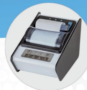
STAMPANTE BLUETOOTH BLUETOOTH PRINTER