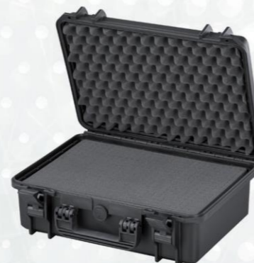
VALIGETTA PER GIOTTO CASE FOR GIOTTO