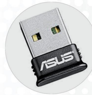
CHIAVETTA BLUETOOTH BLUETOOTH PENDRIVE