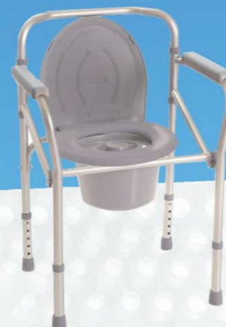
SEDIA DI MINZIONE MICTURITION CHAIR