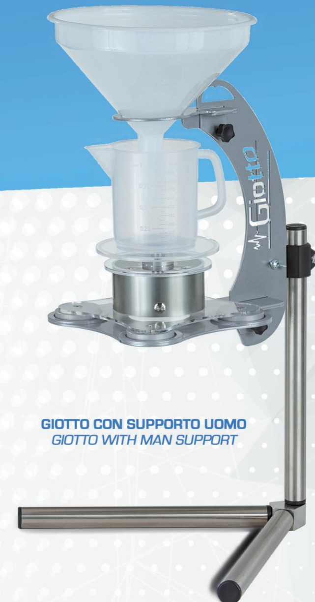
GIOTTO CON SUPPORTO UOMO GIOTTO WITH MAN SUPPORT