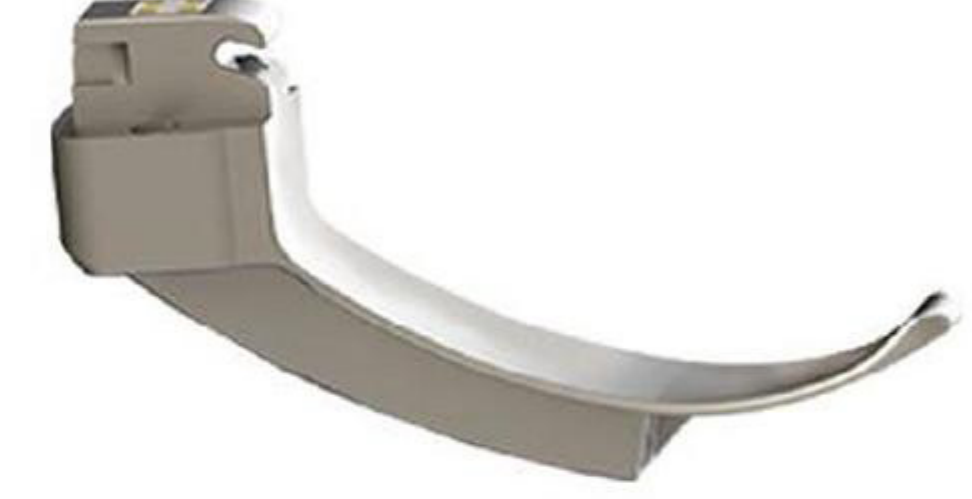
1# 2-6 Yaş