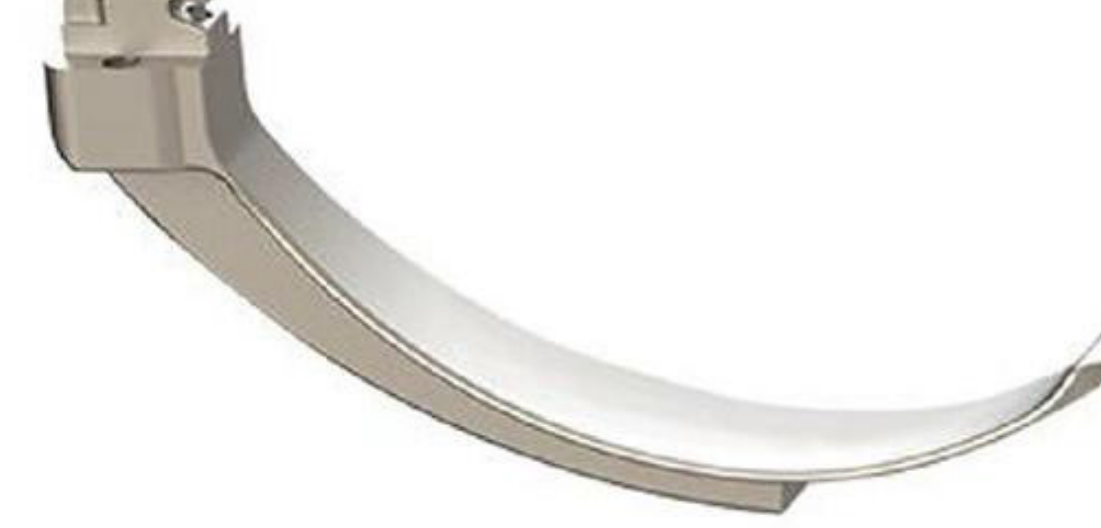
4# Yetişkin, obezite