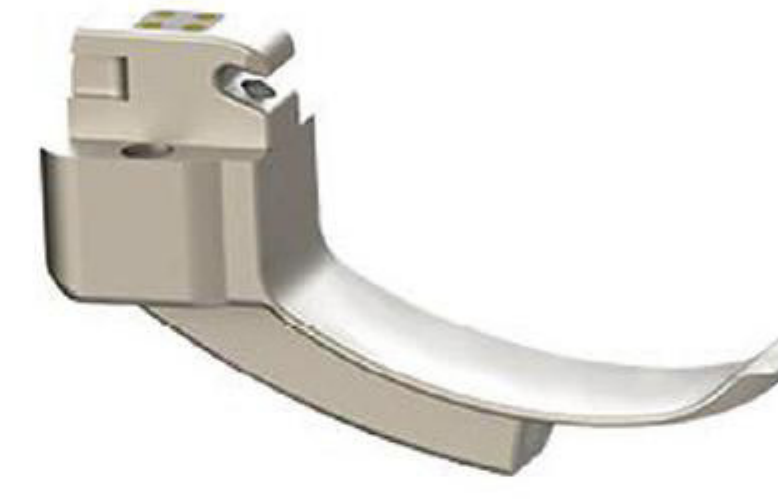
0# 1-2 Yaş