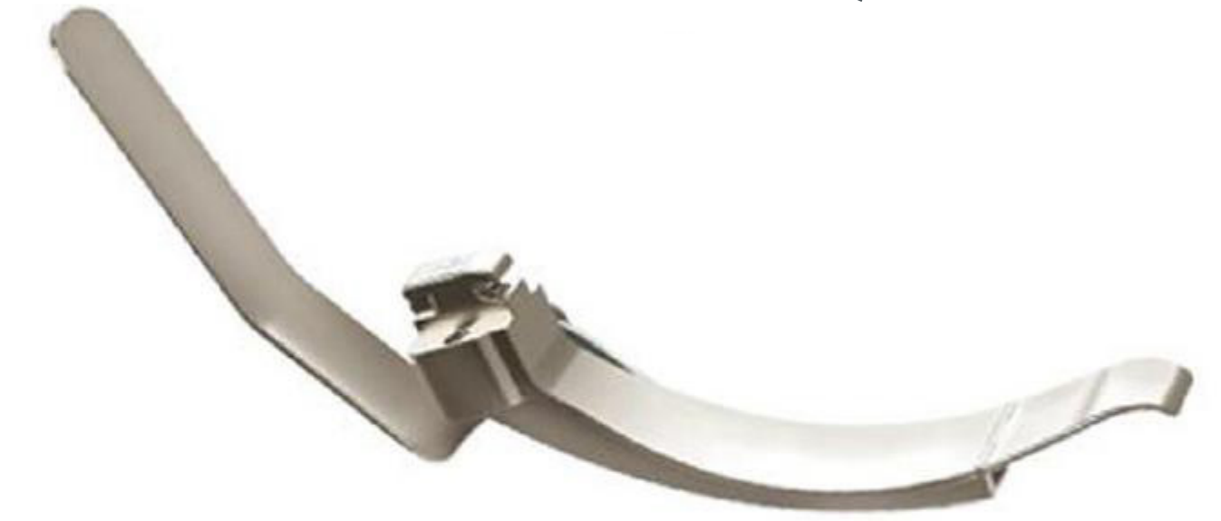
D# Zor entübasyon