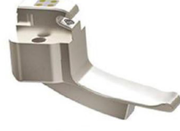
00# 0-1 Yaş