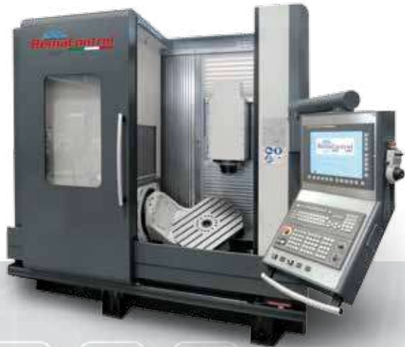
tavola roto-basculante / Dreh- und Schwenktisch turning and tilting table / table rotobasculante

X 450 - 1400 mm Y 450 - 850 mm Z 600 - 800 mm