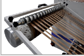
GERGİ KONTROLLÜ FRIKSİYON ŞAFT TENSION CONTROLLED FRICTION SHAFT ФРИКЦИОННЫЙ ВАЛ С РЕГУЛИРОВКОЙ ТЯГИ ПЛЕНКИ