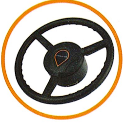
Elektrikli Direksiyon Simidi