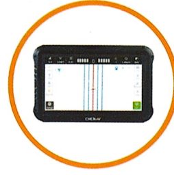
10.1 inç Dokunmatik Ekran