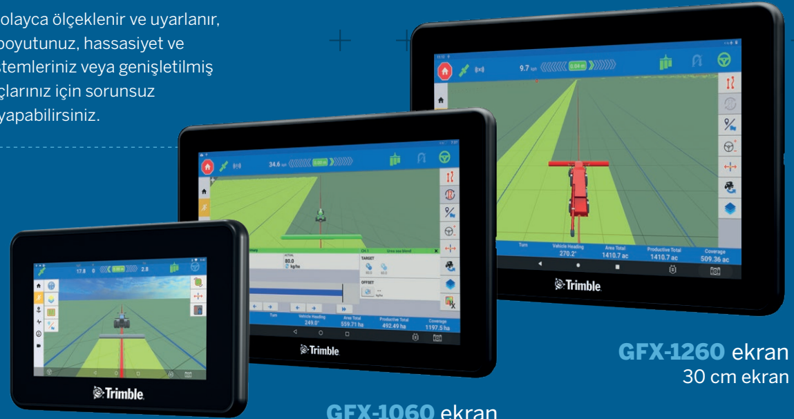
GFX-350 ekran 17 cm ekran

GFX ekranları kolayca ölçeklenir ve uyarlanır, böylece ekran boyutunuz, hassasiyet ve dümenleme sistemleriniz veya genişletilmiş ekipman ihtiyaçlarınız için sorunsuz güncellemeler yapabilirsiniz.