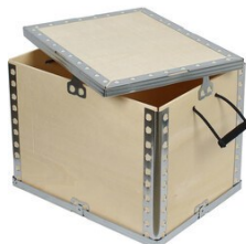
Isıl İşlem Görmüş Ahşap Kasa Ambalajı

MAKSWELL INNOVATION İvedik OSB 1514 Cadde No: 3 Ankara TÜRKİYE +90 312 395 67 37 info@makswell.com.tr www.makswell.com.tr