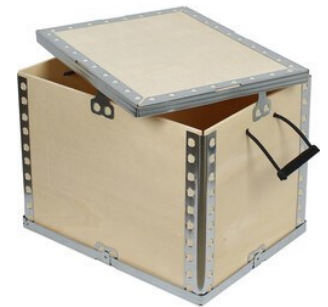
Isıl İşlem Görmüş Ahşap Kasa Ambalaj

MAKSWELL INNOVATION İvedik OSB 1514 Cadde No: 3 Ankara TÜRKİYE +90 312 395 67 37 info@makswell.com.tr www.makswell.com.tr