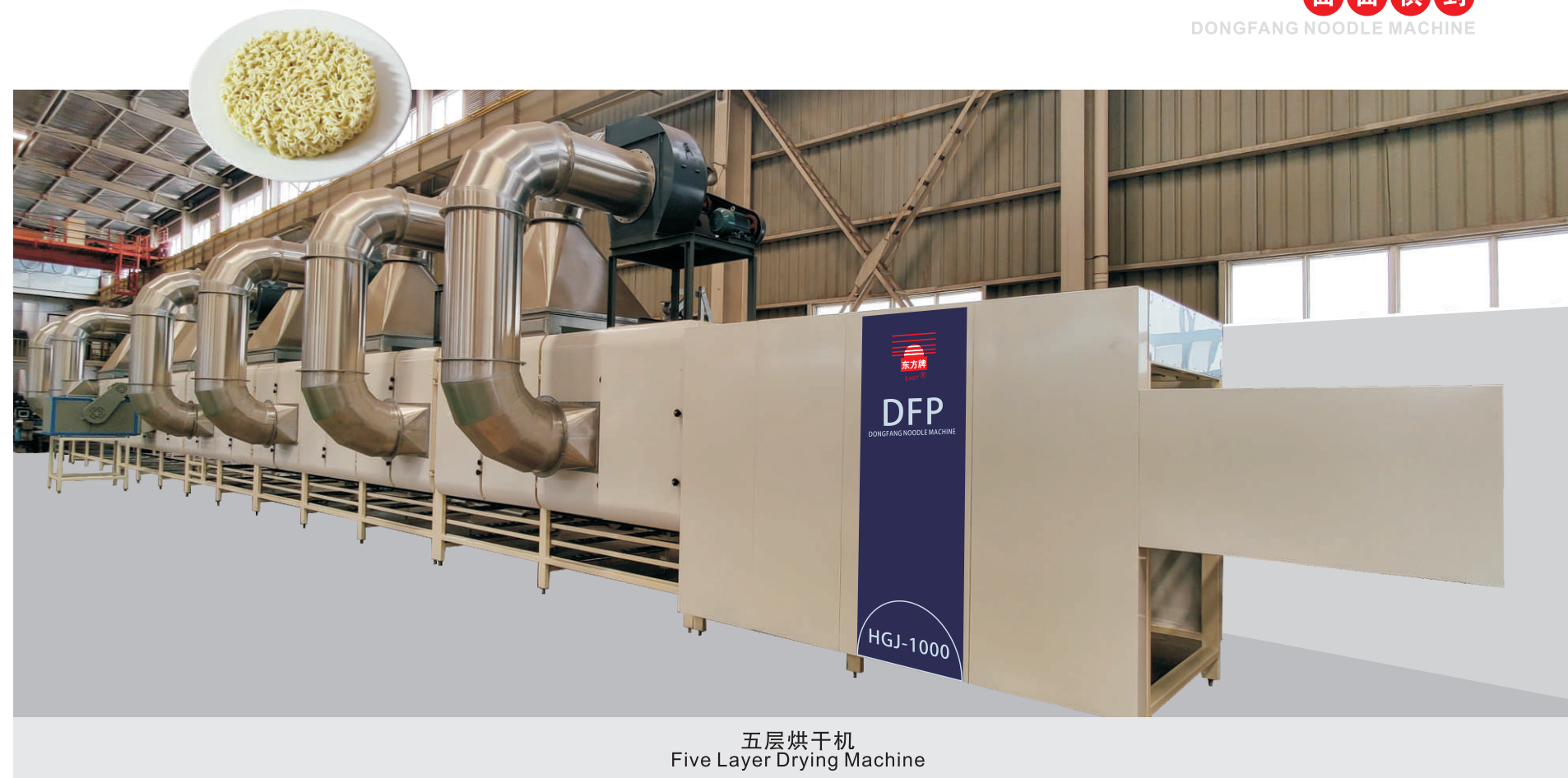
五层烘干机 Five Layer Drying Machine

工艺流程：盐水配置--双轴和面--饧面输送--单片压延--三层蒸面--拉伸切断--吹气整形--热风烘干--冷却--包装 Process Flow Chart: Brine Mixing and Measuring --Mixing--Ripen Conveying--Rolling--Steaming--Stretching and Cutting --Air Blowing and Shaping --Hot Air Drying --Cooling--Packaging