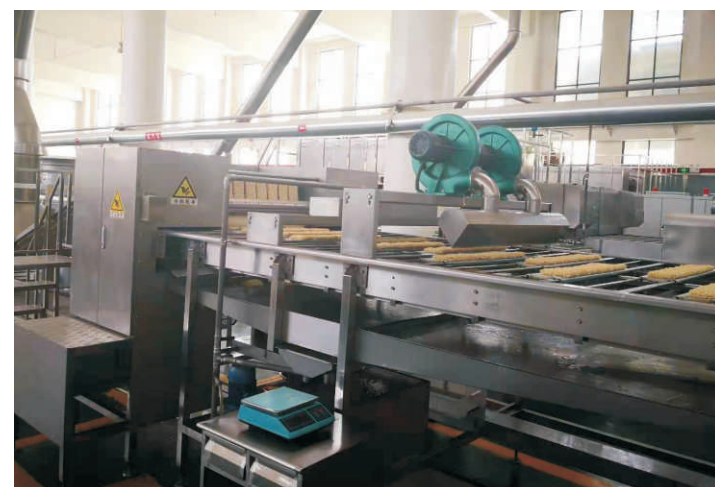
方块面切断分排 Cutting and Dividing