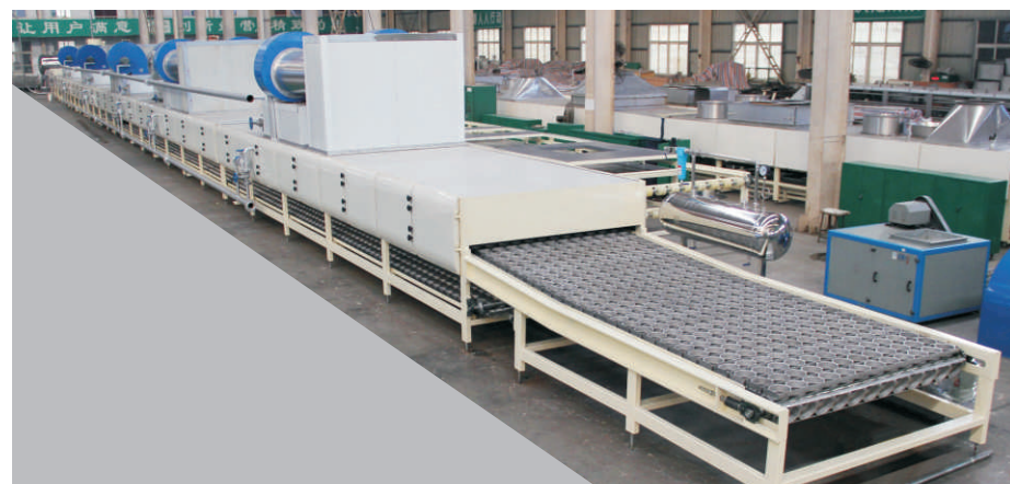
单层烘干机 Single Layer Drying Machine

NON-FRIED SQUARE (ROUND) NOODLE PRODUCTION LINE