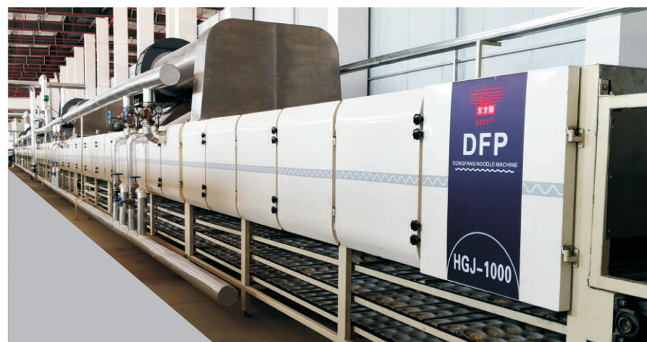
三层烘干机 Three Layer Drying Machine