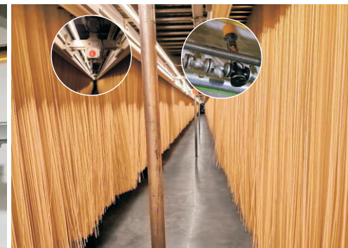
自控型烘房 Automatic Drying Room