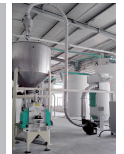
干头粉碎系统 Noodle Pieces Recycle System

工艺流程：原料配给--连续和面--均质搅拌--饧面输送--单片成形--连续压延--给杆切条--上架--自控烘干--下架--切断 --自动回杆--包装