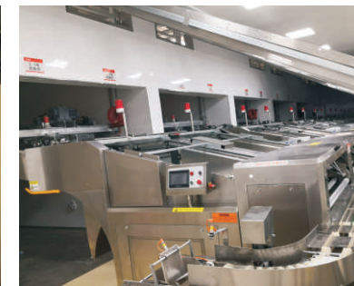
下架 Down-shelve Device