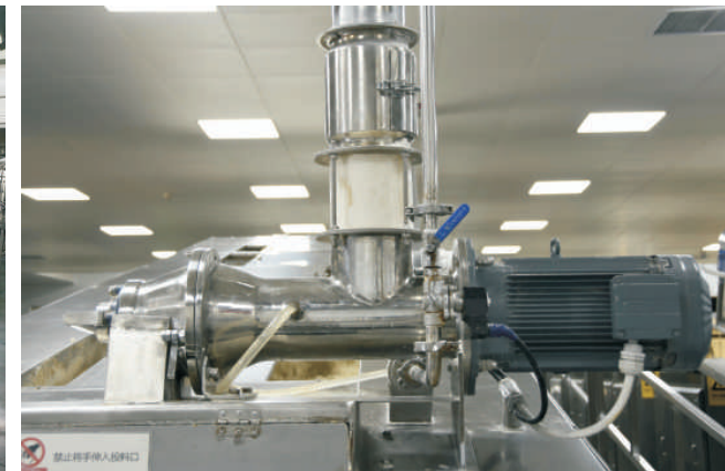
卧式连续和面机 Horizontal Continuous Mixer