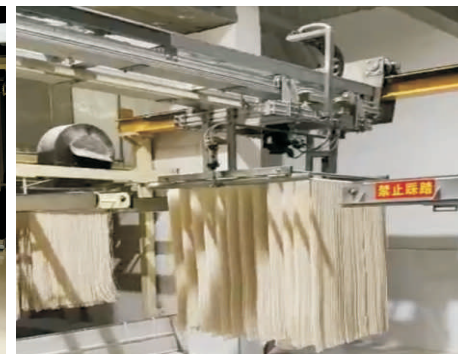
机械手上架 Mechanical Arm Up-shelve Device