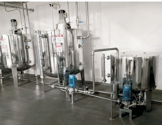
盐水系统 Brine System