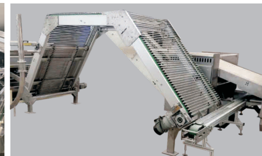
自动回杆装置 Automatic Rod Recycle System