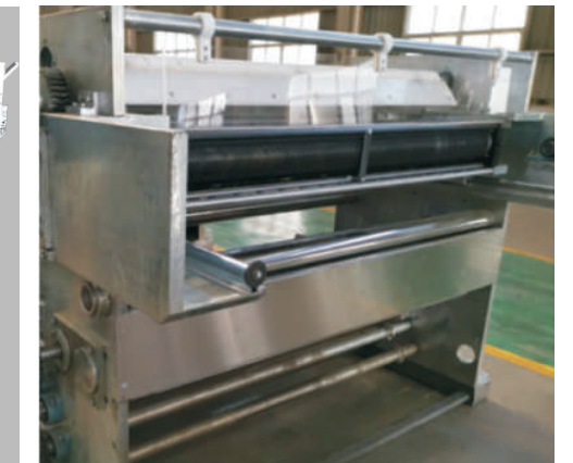
储刀装置 Slitter Storage Device