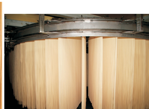
自动转弯 Automatic Turning