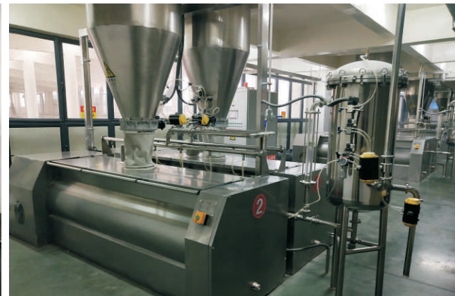
双轴和面机 Dual-axis Mixer