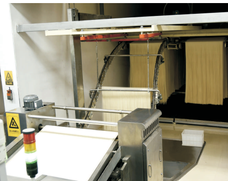
柔性上架 Flexible Up-shelve Device