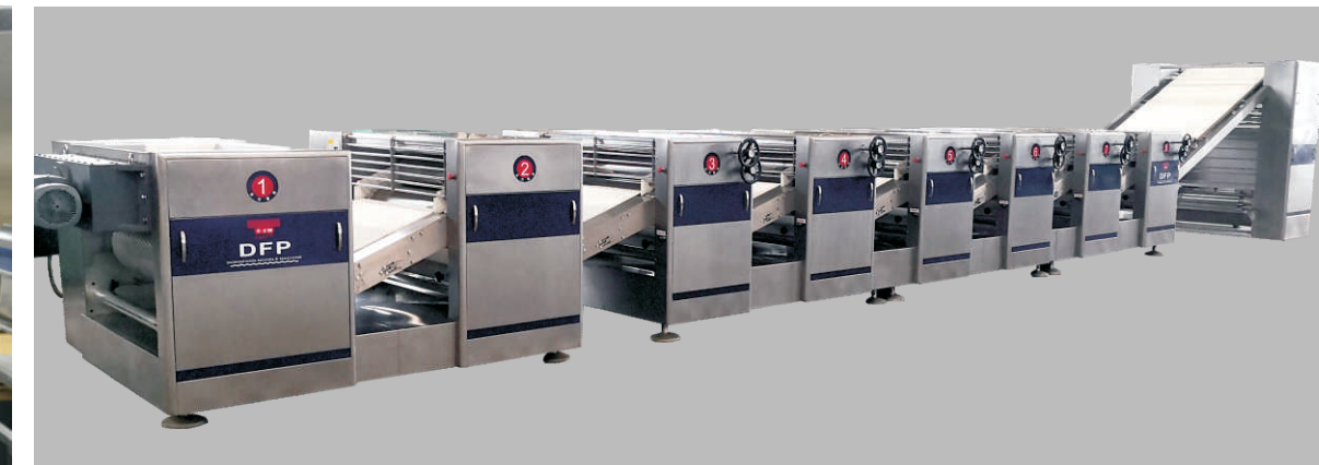
新型压面机 New Type Roller