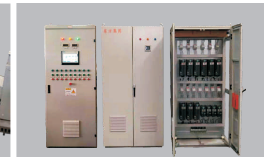
电器柜 Electric Control Panel