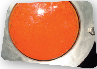
İKİLİ SİSTEM BULL DUAL SYSTEMS BULL (1500 L x 2 )