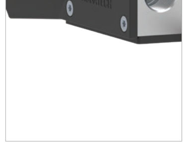
Entegre tutkal filtresi