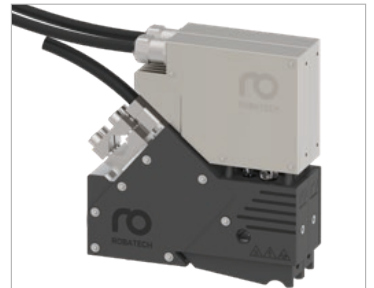
Farklı model alternatifleri