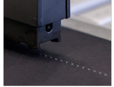
Saniyede 800 nokta