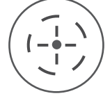
Doğru ve Hızlı

Yüksek ve düşük ısıyı belirten 2 renkli göstergeye sahip aydınlatmalı ekran.