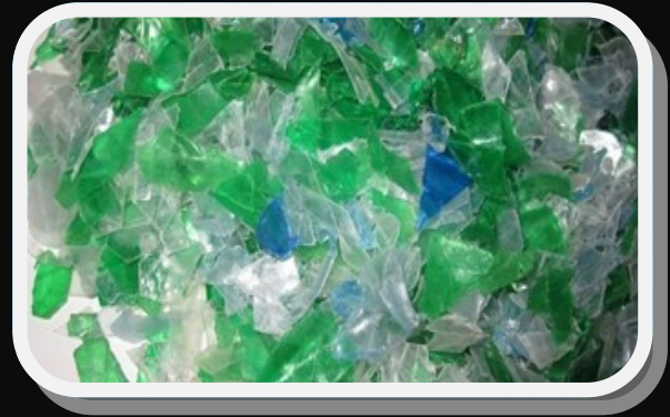
Resim 6 PET FLAKE

Resim 3' de sadece rejenere hammaddeden üretilmiş PET kap, Resim 4' de granül masterbatch ile üretilmiş PET kap ve Resim 5' de SMART LA 5082C ile üretilmiş PET kaplar görülmektedir. SMART LA 5082C'nin ortalama kullanım oranı %0,02 (onbinde iki) dir. Bu kullanım oranı Resim 6 ve Resim 7' deki gibi hammaddenin kalitesine ve yapısına göre değişiklik gösterebilir. SMART LA 5082C üretiminde daha fazla rejenere hammadde kullanmanızı sağlar. ANTI YELLOW AGENT SMART LA 5082C ile daha parlak, daha şeffaf ve değişik tonlarda ürünler elde edebilirsiniz , bunun için değişik tipleri mevcuttur.