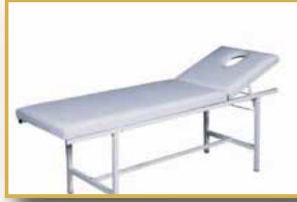
GS09 / MASAJ MASASI