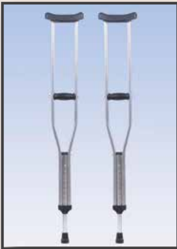
GS34/KOLTUK DEĞNEĞİ YERLİ