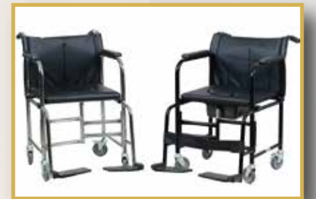
GS19 / KORİDOR ARABASI SİYAH