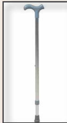
GS35/ELOKSAL PARLAK ASA