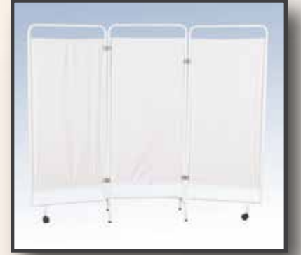
GS10 / 3 KANATLI PARAVAN