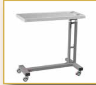
GS15 / ABS YEMEK MASASI