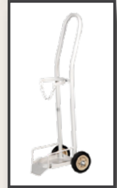
GS16 / OKSİJEN TÜP ARABASI