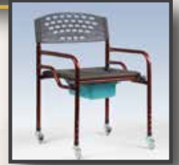
GS23 / DERİ DÖŞEME KLOZET TEKERLEKLİ 25 LİK