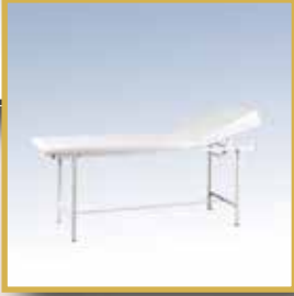
GS08 / MUAYENE MASASI