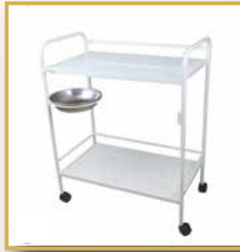
GS12 / PANSUMAN ARABASI