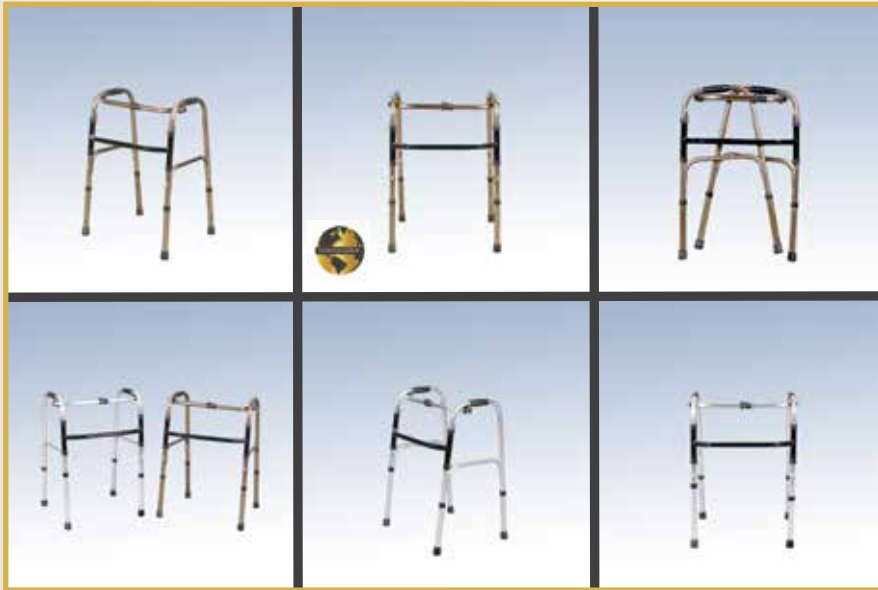
GS28 / ALÜMİNYUM WALKER 22LİK