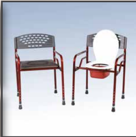
GS23-1 / KAPAKLI KLOZET 25 LİK