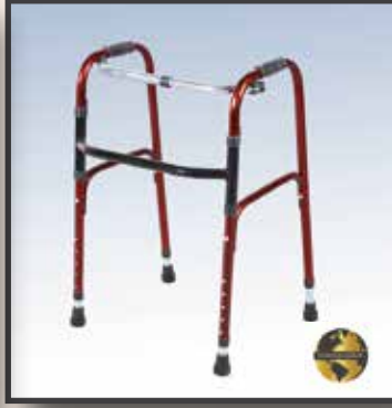
GS26 / METAL WALKER 22LİK