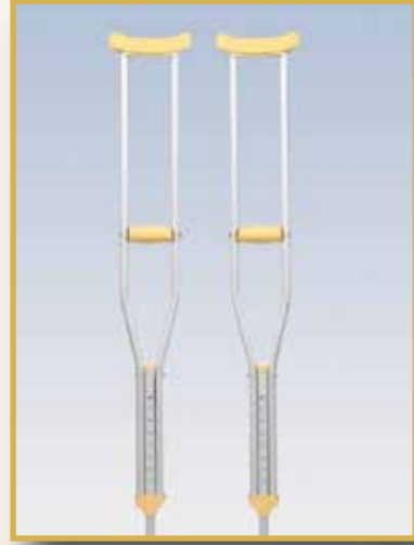
GS33/KOLTUK DEĞNEĞİ İTHAL