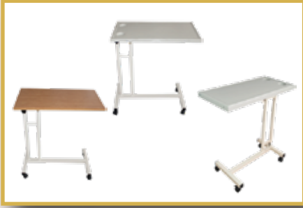
GS14 / AHŞAP YEMEK MASASI