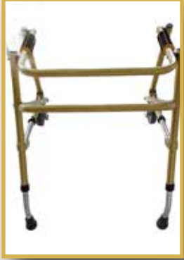
GS30/TERS WALKER 2 TEKER