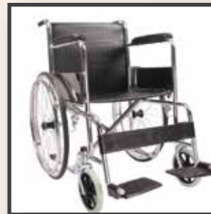
GS18 / TEKERLEKLI SANDALYE