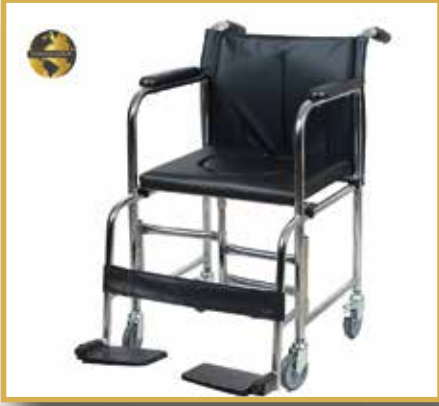
GS20 / KORİDOR ARABASI KROM