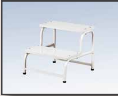
GS11 / 2'Lİ BASAMAK ESKABO