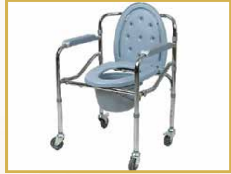
GS21 / KROM KOMOT