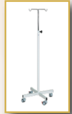
GS13 / SERUM ASKISI