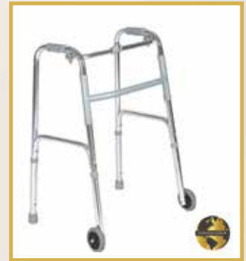
GS29 / ALÜMİNYUM WALKER TEKERLEKLİ 22LİK