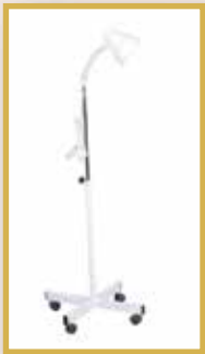
GS17 / REFLEKTÖR