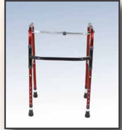
GS25 / METAL WALKER 19LUK