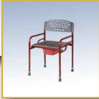
GS22 / DERİ DÖŞEME KLOZET 25 LİK