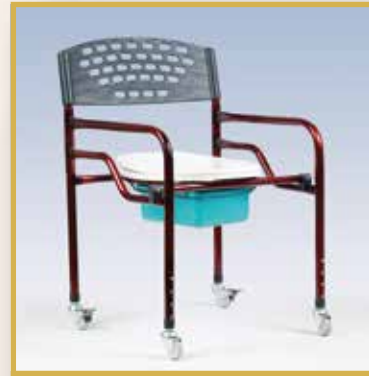
GS23-2 / TEKERLEKLİ KAPAKLI KLOZET 25 LİK