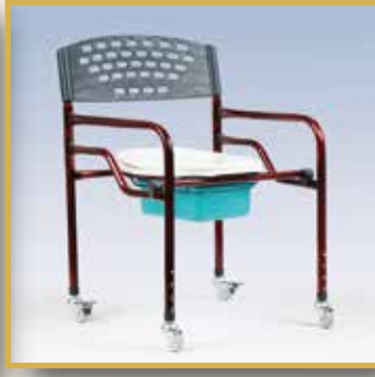
GS24 / KAPAKLI KLOZET TEKERLİK 25LİK