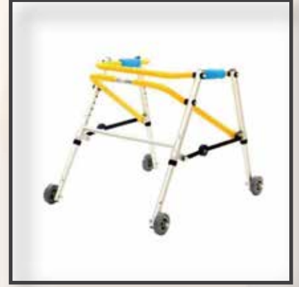
GS31/TERS WALKER 4 TEKER