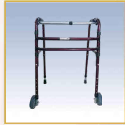
GS27 / TEKERLEKLİ METAL WALKER