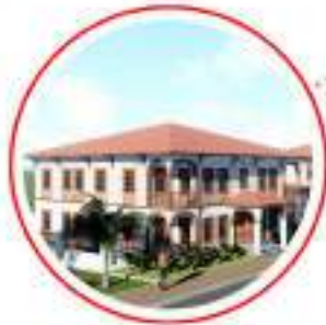
TANZANIA ABDÜLHAMİT HAN YURT & SAĐLIK OCAĐI TANZANIA ABDULHAMIT HAN DORMITORY & HEALTH CENTER