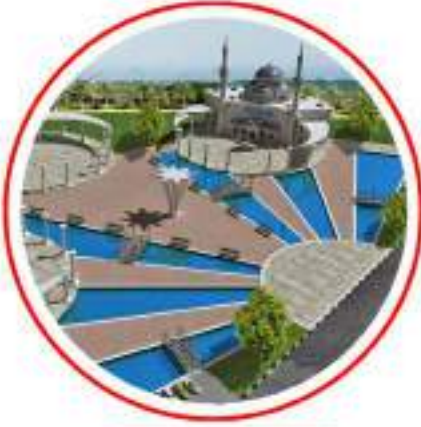
AZERBAIJAN CAMİ AZERBAIJAN MOSQUE