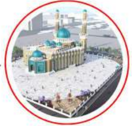
MOĐOLİSTAN ULÄN BATIR İSLAM MERKEZİ MONGOLIA ULAN BATUR MOSQUE