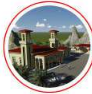
TANZANIA ZANZİBAR 15 TEMMUZ ŐEHİTLER KÜLLYESİ TANZANIA ZANZIBAR 15 JULY MARTYRS MOSQUE & COMPLEX

MİLA'nın Dünya'ya kattđı eserler Works that Mila has brought to the world