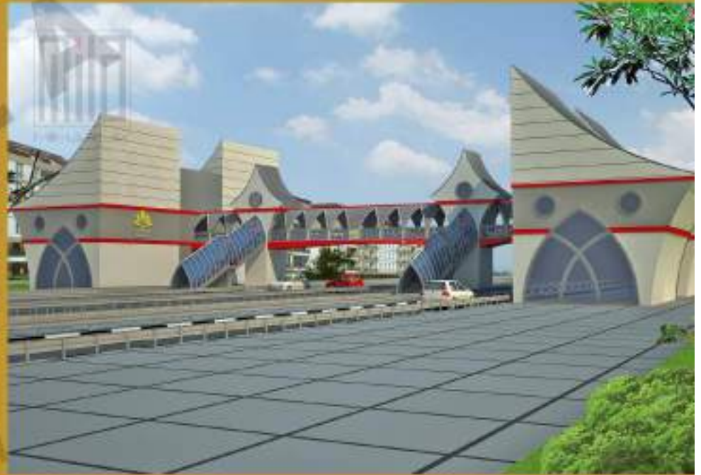
YAYA ÜSTGEÇİTLERİ Post Modern - Selçuklu Mimarisi