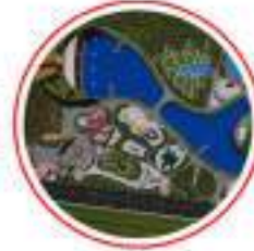
ÖZBEKİSTAN TAŐKENTLÄND EĐLENCE MERKEZİ UZBEKISTAN TASHKENTLAND AMUSEMENT CENTER