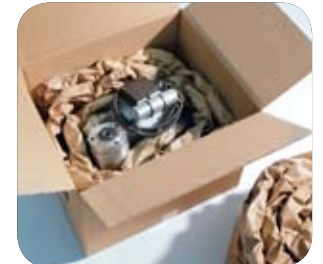
Ürünün etrafından dolanarak veya sarmalayarak ağır objelerin korunmasını ve stabilize edilmesini sağlar.