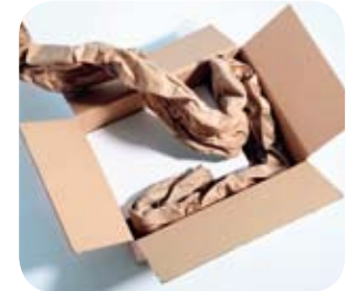
Kutu içinde hareketi önlemek için ürünü sarmalayarak bloklar