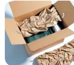
Hafif ve pratik yapısı Boşluk Doldurma Yöntemi için idealdir.