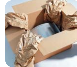
Kırılabılır ürünler için yastıklama yoluyla koruma sağlar.

PAPERplus® GE her çeşit kutu içi koruyucu ambalajlama ihtiyacınızı karşılayacak kağıt tamponlar sunar.