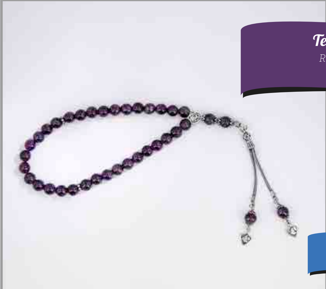
Tesbihler ROSARIES المسابح