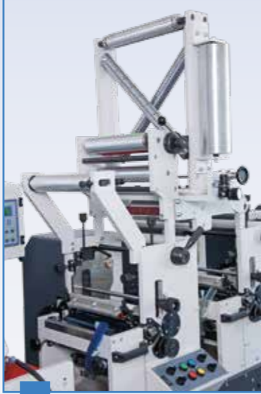
5 Arka ve Yapışkanlı Yüze Baskı Sistemi Web Turn and Delam Relam System

All kind of sticker and triplex material can be applied Flexo Printing. User friendly and easy adjustable system. Fast printing Dr. blade and ceramic anilox system fast adjustment easy dye box and changeable anilox.