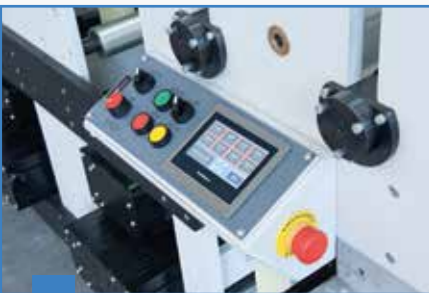
3 Dokunmatik Ekran Touch Screen Panel