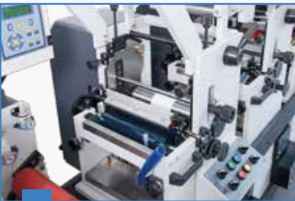
2 Baskı Ünitesi Printing Station