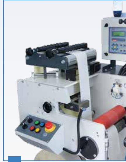
1 Çekici Merdane Niprol Press

Her türlü kendinden yapışkanlı ve triplex malzemelere flexo baskı özelliği. Kullanıcı dostu ve ayar kolaylığı sağlayan sistem. Dr Blade ve Anilox istemi ile hızlıca baskı yapabilmeye özelliği. Kolay boya kutusu ve anilox değişimi sayesinde hızlı baskı ayarı.