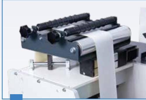
4 Kenar Kontrol Sistemi Web Guide