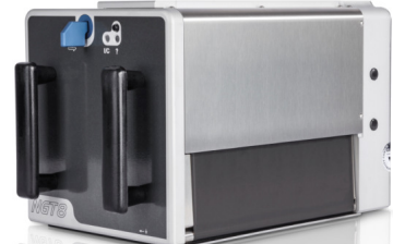
NGT8 / NGT8E