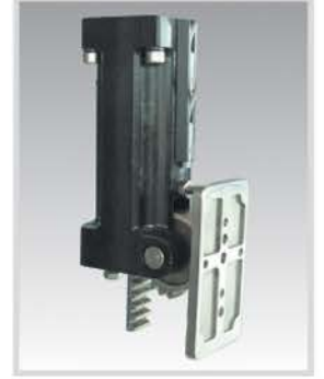
Tutucu Döndürme Sistemi