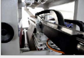
SLOT NOZUL İLE POLİÜRETAN HOTMELT (PUR) TUTKAL UYGULAMA SİSTEMİ POLYURETHANE HOTMELT (PUR) GLUE APPLICATION SYSTEM WITH SLOT NOZZLE ДЮЗА НАНЕСЕНИЯ ПУР КЛЕЯ (ТЕРМОПЛАВКИЙ ПОЛИУРЕТАН)