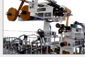
ÇİFT YÜZEY SARMA MODÜLÜ DOUBLE SURFACE WRAPPING ZONE ДВУХСТОРОННЯЯ СИСТЕМА РАЗМОТКИ ПЛЕНКИ