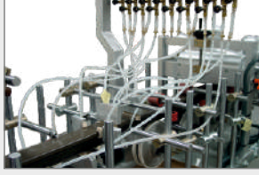
PRİMER UYGULAMA İSTASYONU PRIMER APPLICATION SYSTEM УЗЕЛ НАНЕСЕНИЯ ПРАЙМЕРА