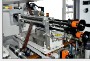
SLOT NOZUL İLE POLİÜRETAN HOTMELT (PUR) TUTKAL UYGULAMA SİSTEMİ POLYURETHANE HOTMELT (PUR) GLUE APPLICATION SYSTEM WITH SLOT NOZZLE ДЮЗА НАНЕСЕНИЯ ПУР КЛЕЯ (ТЕРМОПЛАВКИЙ ПОЛИУРЕТАН)