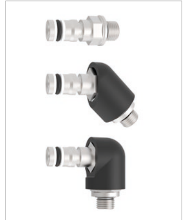
0°, 45°, 90° vida bağlantıları