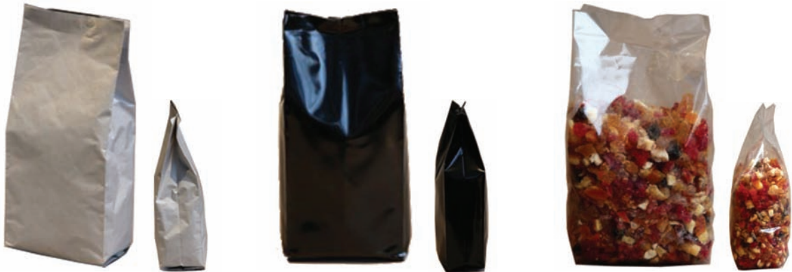
KUŞE KÖRÜKLÜ TORBA