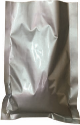
ALÜMİNYUM YASTIK TORBA

Different material combinations are possible: PET, ALU, PE, CPP, OPP, matt OPP, OPA, KRAFT Paper, met PET, etc.