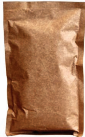
KRAFT YASTIK TORBA