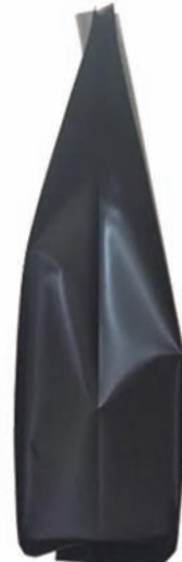
SİYAH QUADRO TORBA