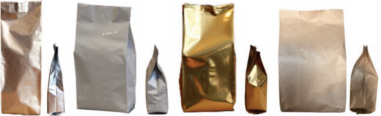
ALÜMİNYUM KÖRÜKLÜ TORBA

Different material combinations are possible: PET, ALU, PE, CPP, OPP, matt OPP, OPA, KRAFT Paper, met PET, etc.