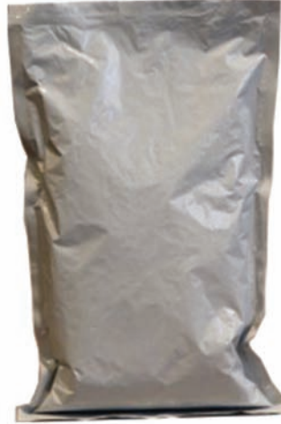
BEYAZ YASTIK TORBA