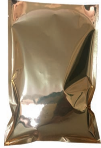
GOLD YASTIK TORBA