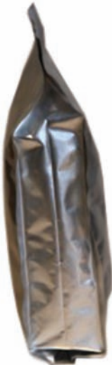
ALÜMİNYUM QUADRO TORBA