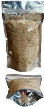
YARI ŞEFFAF DOYPACK