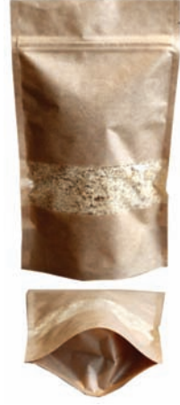
KRAFT PENCERELİ DOYPACK