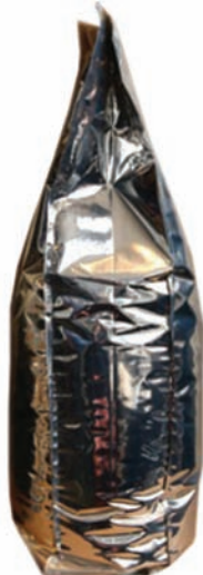
METALİZE QUADRO TORBA