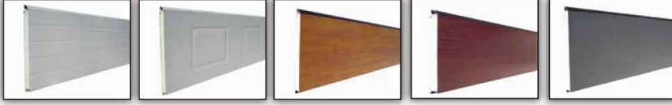
Standart Panel Standard Panel