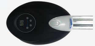
PULL 1000 L