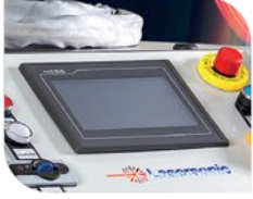
LCD Kontrol Paneli