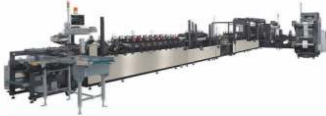
TORBALAMA / BAG CONVERTING