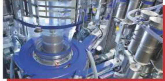
EKSTRÜZYON / EXTRUSION