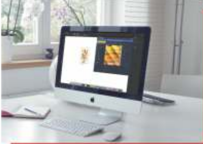
BASKI ÖNCESİ HAZIRLIK / PRE-PRINTING