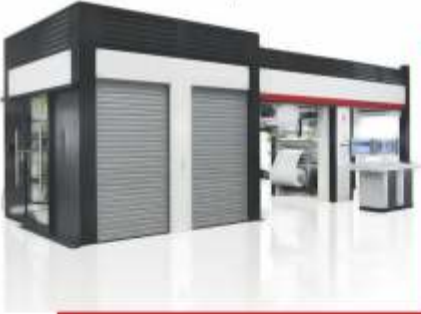
BASKI / PRINTING