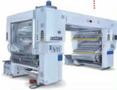
LAMİNASYON / LAMINATION