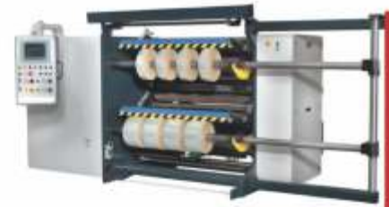
DİLİMLEME / SLICING